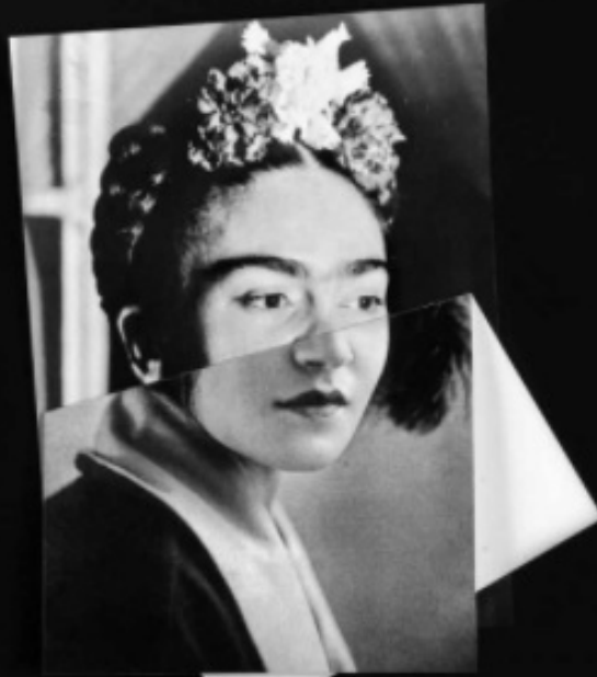
FRIDA - MODOTTI From the Series: Proteus Syndrome