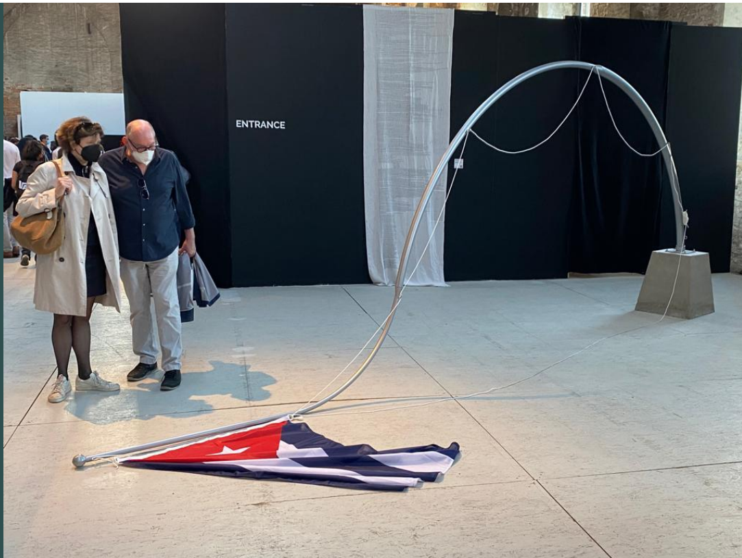
Finalista Prémio Laguna / Laguna Art Prize Finalist