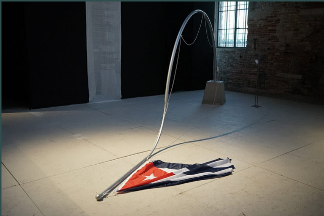
Finalista Prémio Laguna / Laguna Art Prize Finalist

work consists of a series of portraits made using the collage technique from archival images, which are made up of the complicity that I created when folding the photographs of some characters and superimposing them on others. corrupting the original faces and transforming them into other unrecognizable, unknown, but possible. Proteus syndrome (congenital pathology characterized by the gradual deformation of the organism), and which, in turn, alludes to the Greek God Proteus, which could mutate and assume multiple forms not to be discovered.