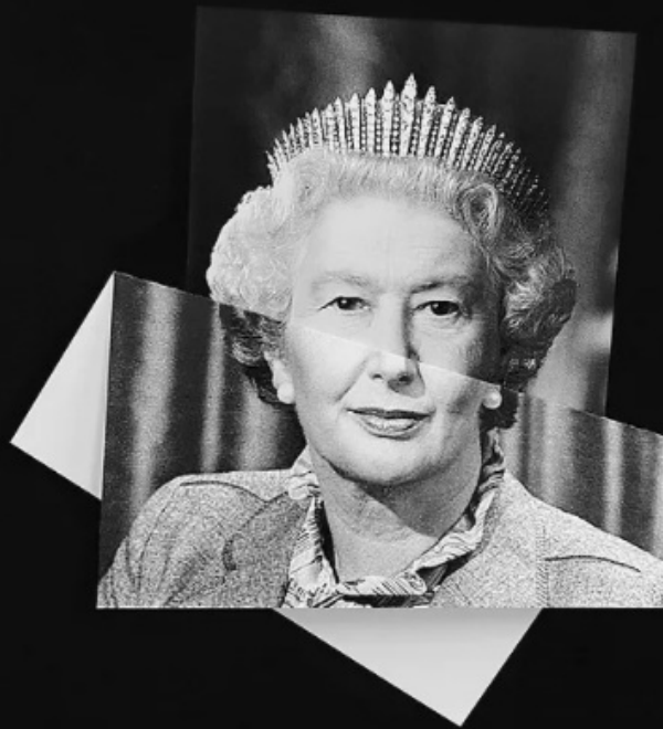
"REINA ISABEL - THATCHER" De la Serie: "Síndrome de Proteus" Colagem / Printed photo collage 45 x 40 cm