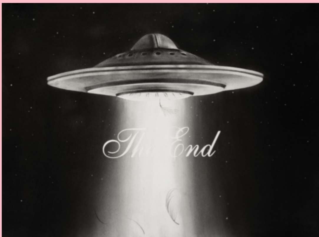
El buscador de verdades, 2019