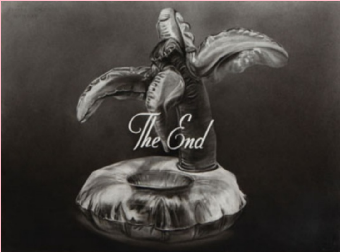
Unseen Presence of Victorious Corruption, 2019