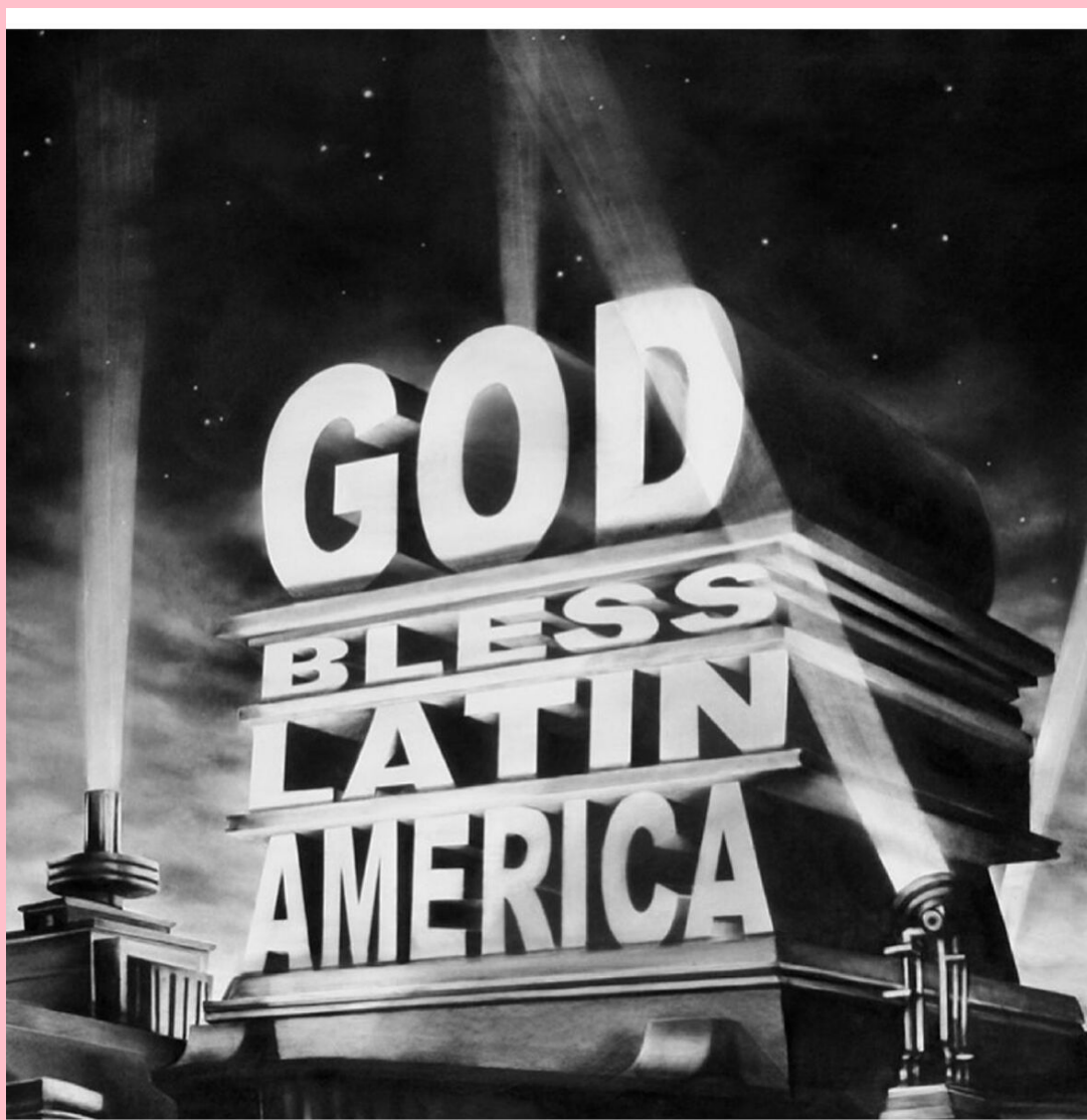
God Bless Latin America 2014

Aconselhamento para aquisição de obras de arte | Consulting for art acquisitions