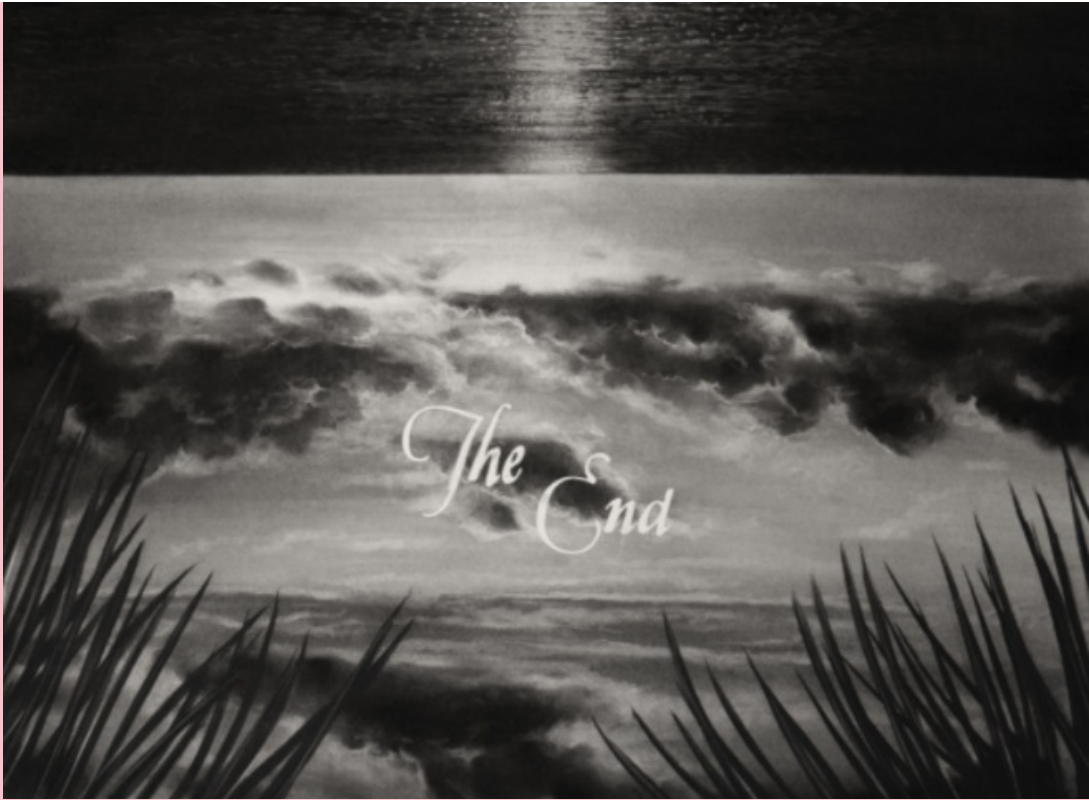
Imaginaciones del miedo, 2019