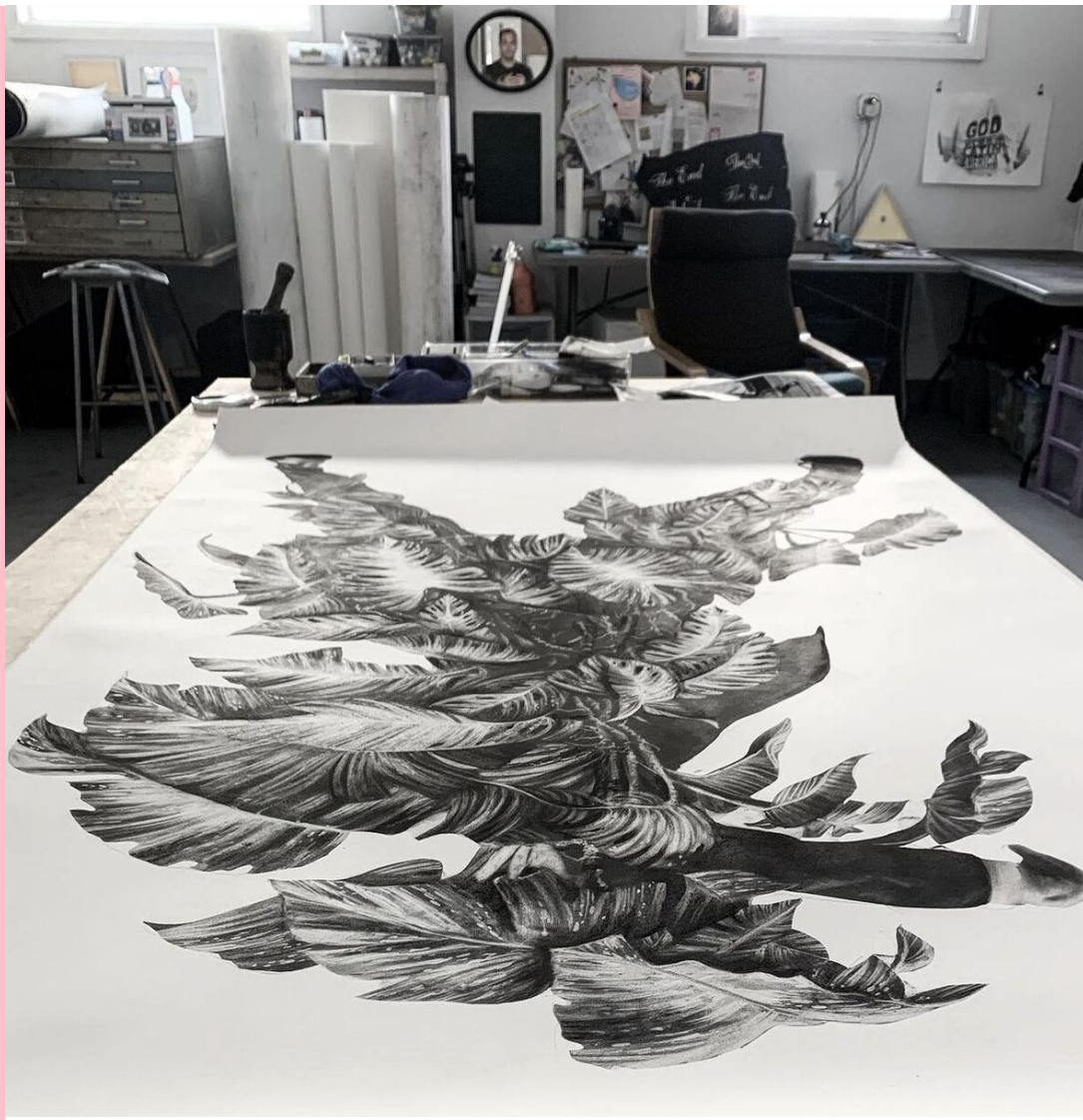
Artist's Studio / Estúdio do artista