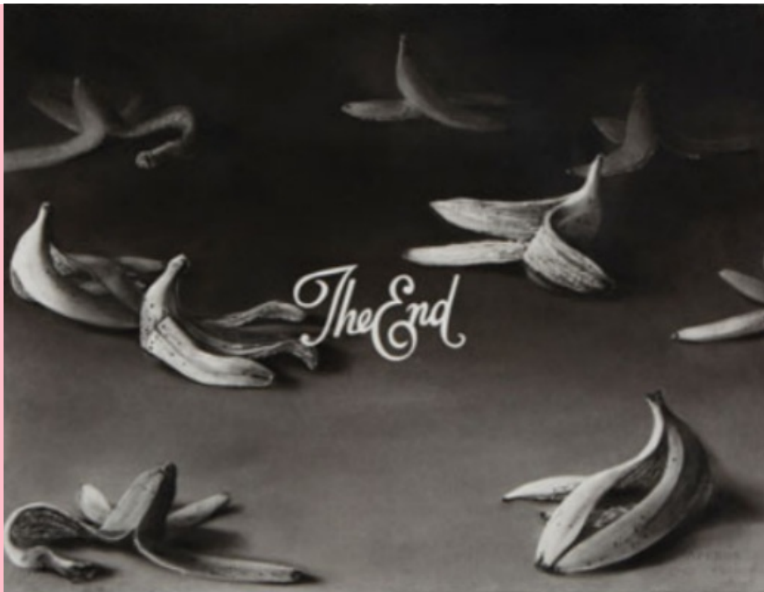
Gonzalo Fuenmayor, Flavour of Mortality, 2019