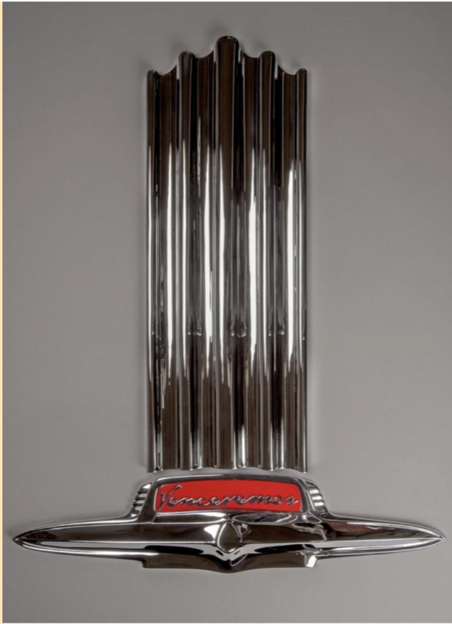
Venceremos Pontiac, 2018 Chromed bronze 77 x 63 + 4cm