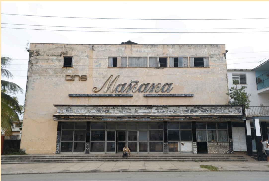
Mañana, 2021 Diasec con balitado y bastidor de aluminio 56x84cm