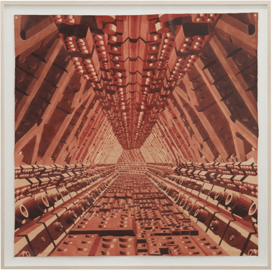
Corredor 14, 2019 Watercolor and graphite on paper 130x130cm