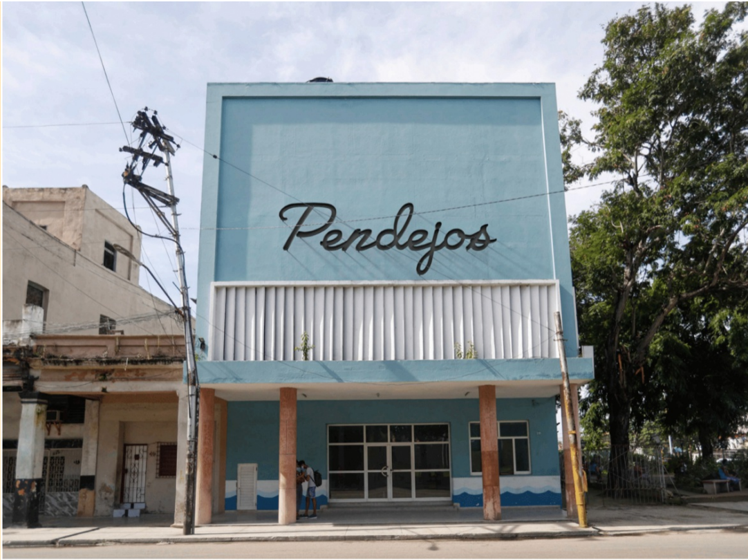
Pendejos, 2021 Diasec con balitado y bastidor de aluminio 56x84cm