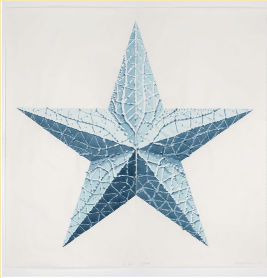
No Estrella Azul, 2018