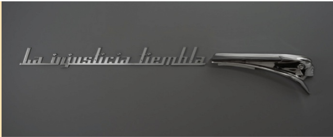
La injusticia tiembla, 2018

Curator's Choice é uma seleção criteriosa de obras de artistas em que acreditamos no seu percurso e trabalho. Uma escolha com atenção ao seu corpo de trabalho e trajetória.