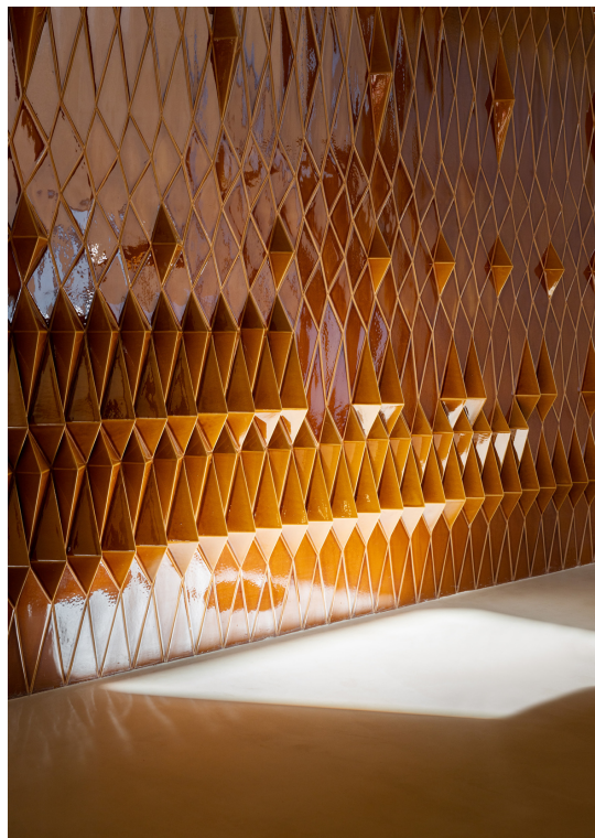
MAVC Praia do Canal