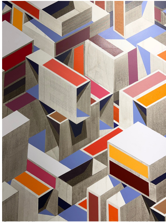
Detalle. Lilas y naranjas que van a arder, 2022 Acrílico/ tela 277 x 248 cm