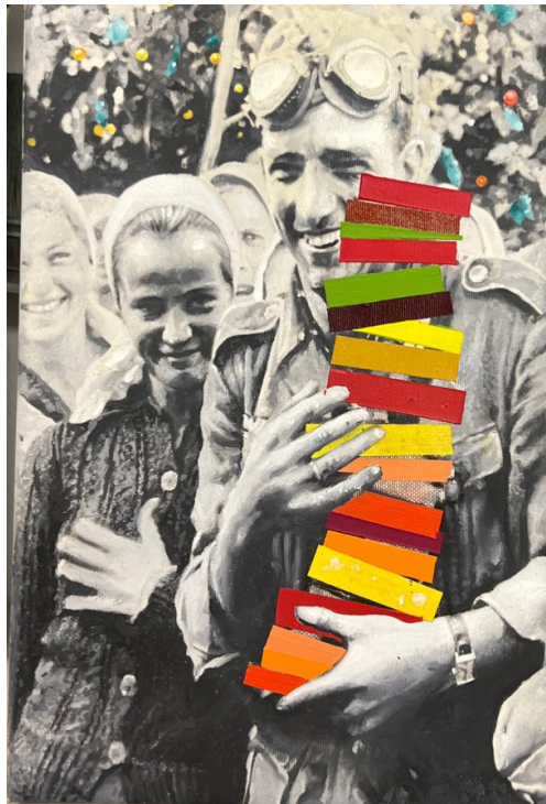
De historias tristes pintadas con alegría, 2015 Acrílico / tela 30 x 20 cm