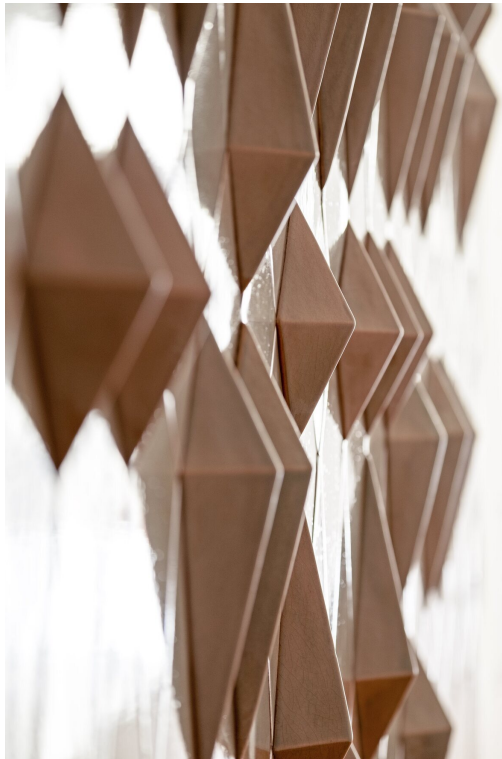
MAVC chagas