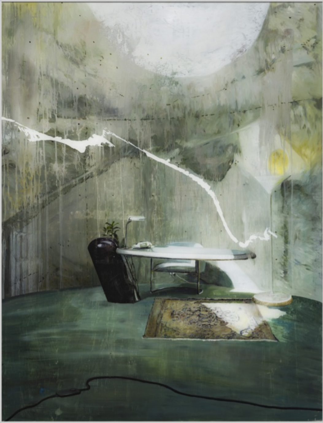
The Lightning, 2020