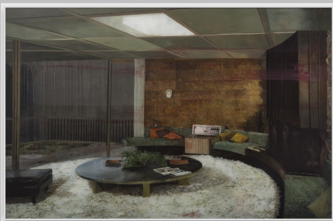
Untitled, 2020 Fotografia 80 x 80 Ed. 1/3 + PA

Aconselhamento para aquisição de obras de arte | Consulting for art acquisitions