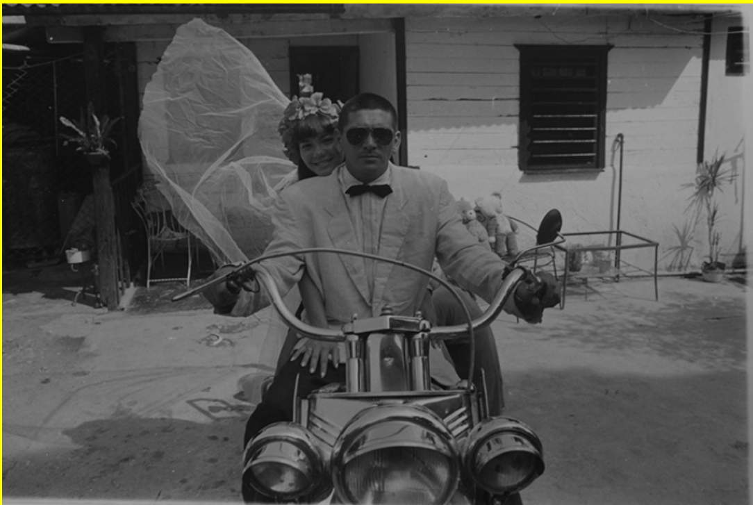
Sin título, 1995. Série Harley Davidson, 1995 – 2010 Fotografia 41 x 31 cm, Edição única