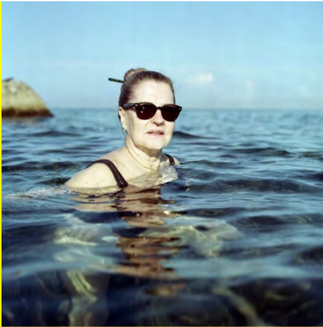
Sin título, Série Nacidos para ser libres, 2012 Inkjet sobre papel fotográfico / 47 x 46 cm, Ed. de 5 + 2 P/A