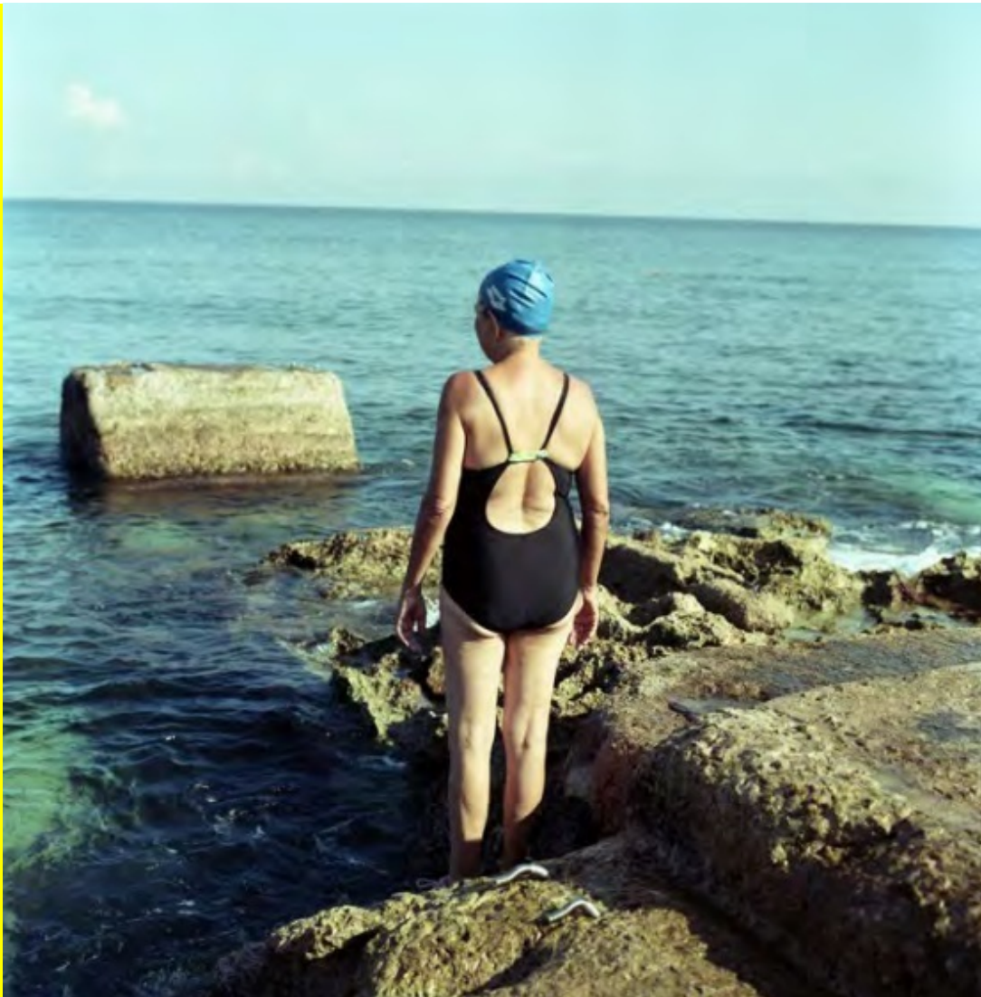
Sin título, Série Nacidos para ser libres, 2012 Inkjet sobre papel fotográfico / 47 x 46 cm, Ed. de 5 + 2 P/A